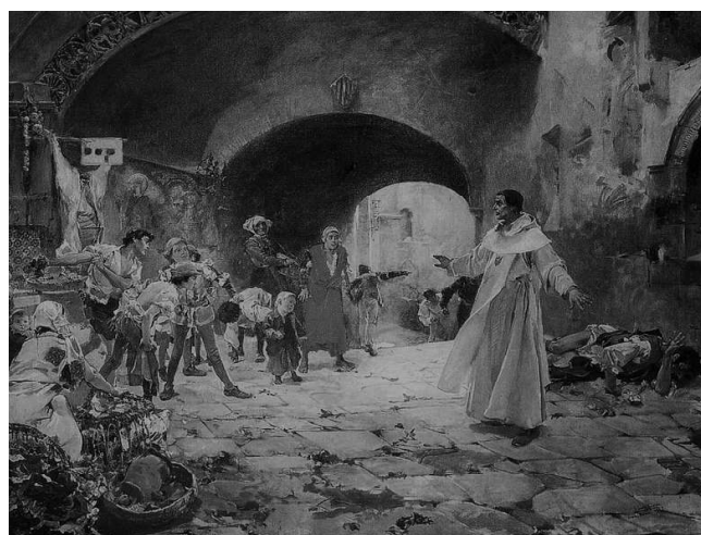
Figura 2. El padre Jofré defendiendo a un loco, obra del pintor valenciano Joaquín Sorolla (1863-1923); que se conserva en el Palacio de la Generalidad Valenciana (España)

La historia nos recuerda que, “en Valencia se produjo un hecho que transformó para siempre el destino de los enfermos mentales en el mundo cuando fray Joan Gilabert Jofré, un sacerdote mercedario, pidió a sus feligreses protección y cuidados para los “locos e inocentes”. La respuesta fue la creación del primer hospital psiquiátrico del mundo”, 19 que fue nombrado “Hospital dels Innocents, Folls e Orats, que hoy llamaríamos de retrasados mentales, psicóticos y dementes”. 19 (Figura 2)