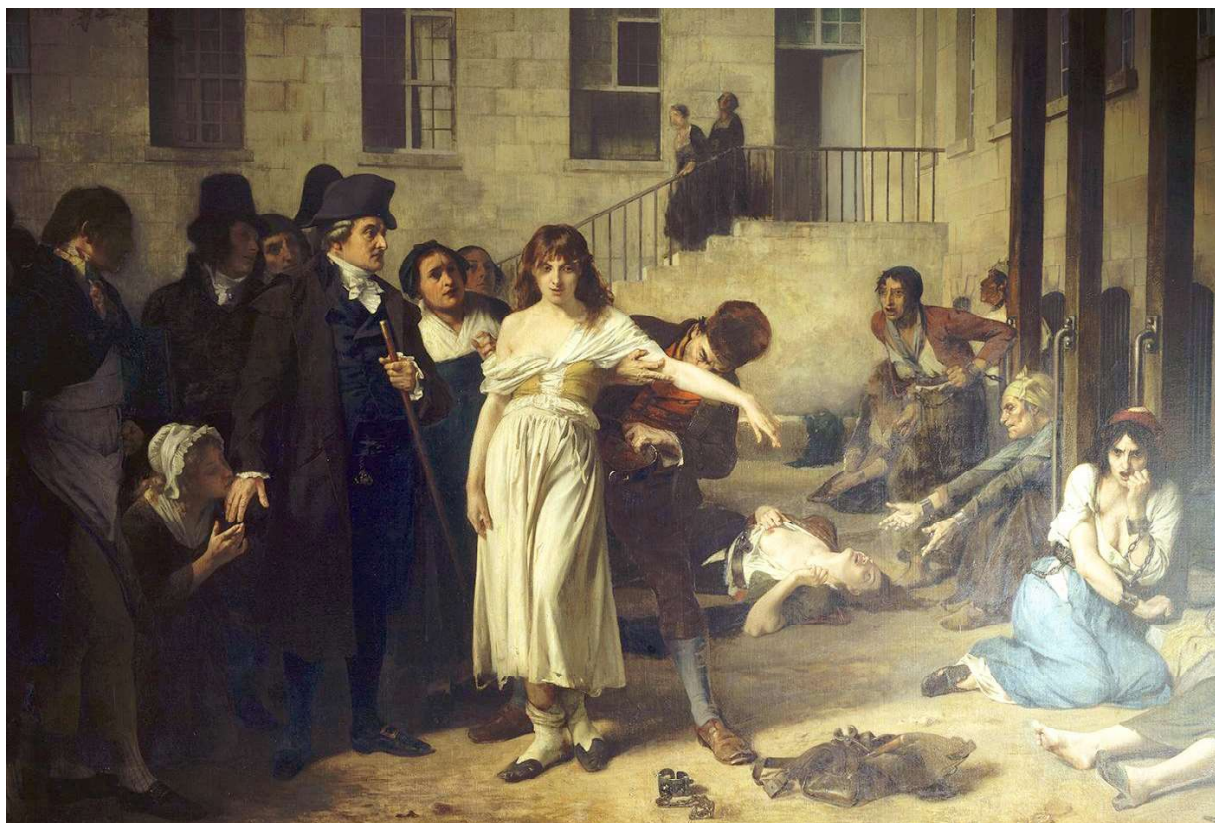
Figura 4. Pinel en La Salpêtrière liberando de sus cadenas a una paciente, obra del pintor francés Robert Fleury (1837-1911)

Algunos autores hacen surgir en éste contexto, la creación de la Psiquiatría, pues se observa que dicho término “nacido en 1842 luego de la Revolución Francesa, remite de una manera parcial al mito de Psique”; 22 pues, la mitología griega ve en ella a la diosa adolescente, con alas