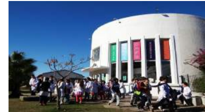
Vista del local de SALASUR, ex cine de La Floresta totalmente reciclado y equipado

Una característica común de los integrantes y docentes del Proyecto, era que se trataba de personas, artistas y docentes, residentes en la zona o en localidades cercanas.